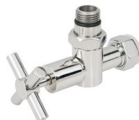
Вентиль запорный (крестовой) G 1/2" НР x 3/4" НГ арт. 01002-1234