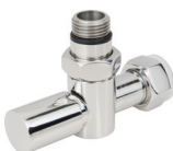
Вентиль запорный (круглый) G 1/2" НР x 3/4" НГ арт. 01000-1234