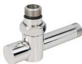
Вентиль запорный (скрытый) G 1/2" НР x 1/2" НР арт. 01001-1212