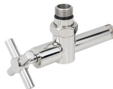
Вентиль запорный (крестовой) G 1/2" НР x 1/2" НР арт. 01002-1212