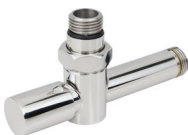
Вентиль запорный (круглый) G 1/2" НР x 1/2" НР арт. 01000-1212