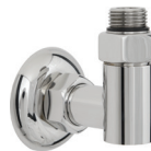
Набор комплектующих для PC G 1/2" НР x G 3/4" НГ арт. 03002-1234