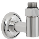
Набор комплектующих для PS G 1/2" НР x G 1/2" НР арт. 03003-121