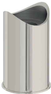
Модуль скрытого подключения для МЭМ «Сунержа» d 28мм арт. 00-1522-0028

Используя модуль скрытого подключения возможна установка электрического дизайн радиатора от компании «Сунержа» в нужном для вас месте без видимых проводов.